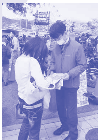
会の方々と一緒に署名活動をする味口としゆき議員